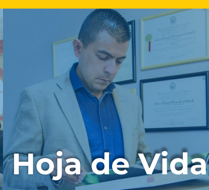
Hoja de Vida