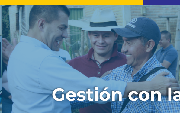
Gestión con la comunidad